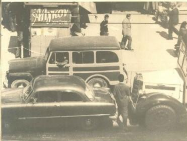
ΣΚΕΦΘΗΚΑΤΕ γιατί τί θα γίνει αν η στιγμή που περνάτε άσχημα, άναμεσα από δύο σταο- τημένα αμαξίδια, λυθείτε τα φρένα του ενός ή ο άλλος τρίτο πίσω έναλλάξ ξαφνικά άναυχο τους.